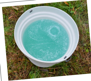
Mischen ist nicht erforderlich!