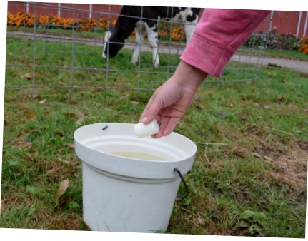
Lösen Sie ein BlueLite C HydraTab in 1 Liter Wasser (vorzugsweise lauwarmes Wasser), für den täglichen Gebrauch